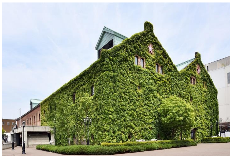
サッポロファクトリー レンガ館 外観

サッポロ不動産開発株式会社 札幌事業本部（所在地：北海道札幌市中央区北2条東4丁目）は、歴史的価値のあるサッポロファクトリーレンガ館を今後も長く活用するため、耐震補強工事を行うこととなりました。ご利用いただく方々に安全・安心な環境をご提供するとともに、創成イーストエリアに新たな価値をもたらすことができる館として生まれ変わります。